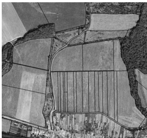
stav po pozemkových úpravách